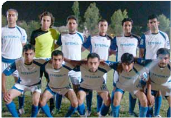
تیم استقلال - [عکس: سعید توکل]

تا پایان هفته سوم پس از شکست ناباورانه خود در هفته اول دو بازی بعدی را مقابل پرسپولیس نوین و گراش جوان با پیروزی پشت سر گذاشت و با تساوی با شاهین در هفته چهارم اکنون ۷ امتیازی است. شاهینی‌ها یک برد و سه تساوی دارند. شاهینی‌ها در هفته اول با جوشن به تساوی رسیدند و هفته دوم ستاره‌آبی را با دو گل شکست دادند و در هفته سوم با گراش جوان نتیجه را تقسیم کردند. اتحاد تا پایان هفته سوم با دو تساوی و ۱ برد ۵ امتیازی بود. تیم‌های گراش جوان و شهدا با ۴ امتیاز، پرسپولیس نوین و مقاومت با ۳ امتیاز و جوشن و ستاره‌آبی با ۱ امتیاز رده‌های چهارم تا نهم را در اختیار دارند.