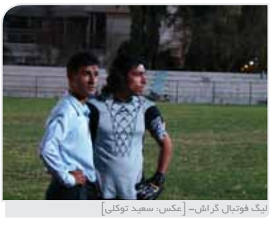
لیگ فوتبال گراش