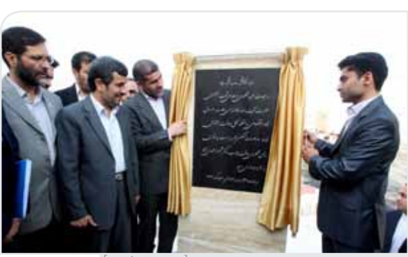
دکتر احمدی‌نژاد * ۸ واحد مسکن مهر اوز را افتتاح کرد- [عکس: president.ir]

در گوشه‌های دیگر آن معادن غنی دیگر وجود دارد که اینها همه از نعمات الهی هستند که در اختیار ملت ایران قرار دارد. دکتر احمدی نژاد با طرح این سوال که چرا با وجود معادن و ذخایر غنی هنوز زمین آباد نشده است، اظهار داشت: مهمترین دلیل این مسئله اقامه نشدن عدالت است، زمانی که عدالت مستقر شود انسان ها به حقیقت انسانی و کرامت دست پیدا کرده و در مسیر پیشرفت و رفاه گام برمی دارند. به گزارش سایت هیات امنا دانشگاه