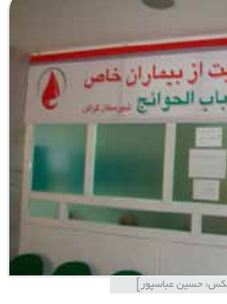
انجمن حمایت از بیماران خاص در بیمارستان - [عکس: حسین عباسپور]

دبایت، ام اس و بیماری‌های کلیوی نیز در آینده تحت حمایت انجمن در خواهند آمد. عباسپور می‌گوید: «هم‌اکنون در خنج بخش‌های دیالیز و تالاسمی فعال است؛ ولی بیمارانی که نیاز به شیمی‌درمانی دارند باید به شیراز مراجعه کنند. همین ایاب و ذهاب و اقامت و غیره، هزینه‌ی آنها را بسیار بالا می‌برد. امیدواریم هر چه زودتر این هزینه‌ی اضافی را از دوش این بیماران برداریم. البته انتظار داریم خیرین هم در زمینه‌ی مالی به ما کمک کنند. به این منظور، شماره حساب ۸۰۱۰۰۲۳۰۹۸۰۱ بانک پارسیان نیز به نام انجمن برای دریافت کمک‌های مردم و خیرین افتتاح شده است.» علاوه بر این خدمات درمانی، انجمن در بحث مشاوره برای بیماران خاص و ارتباط با نهادهای بالاتر هم فعال