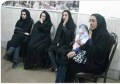
روز خبرنگار