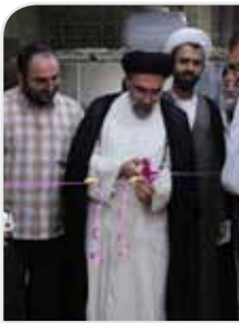
افتتاح مجمع الذاکرین