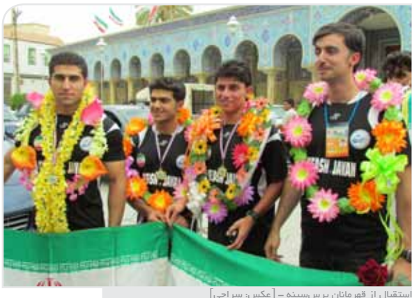
استقبال از قهرمانان پرس‌سینه

سه مدال طلا حاصل سفر پرس کاران گراشی به کشور تایوان بود. بعد از ظهر پنجشنبه ۲۷ مردادماه تیم پرس‌سینه گراش که با دست اسدی با رکورد ۱۲۷ و نیم کیلوگرم پر از مسابقات آسیایی پرس‌سینه چین تایپه بازگشته بود از سوی مردم استقبال شد.