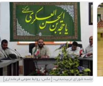
جلسه شورای تربیت بدنی