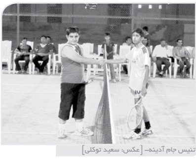
تنیس جام آدینه - [عکس: سعید توکل]

ایجاد تحرک و هیجان قدرت در بازیکنان و اعتماد به نفس آنها. شما باید به گونه ای رفتار کنید که هر بازیکن احساس کند، دارای نقش و اهمیت است.