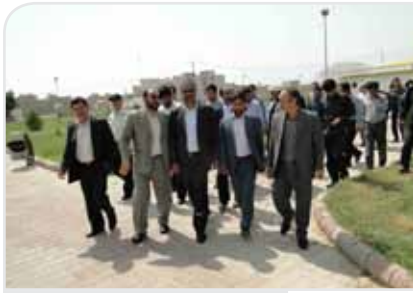
حضور معاون عمرانی استاندار در بوستان باران

گریشنا: صادق رحمانی شاعر گراشی به عنوان یکی از برگزیدگان مسابقه شعر انتفاضه معرفی شد. عبدالرحیم سعیدی راد در آستانه روز قدس در مصاحبه با خبرنگاری فارس اسامی ده برگزیده مسابقه شعر انتفاضه را معرفی کرد. این مسابقه از سوی بخونه هنری برگزار شده بود. در حوضه از شعر صادق رحمانی برای فلسطین آمده است: در هوای شاقوتی تازه حامیان کبوتر و شادی موج در موج تکه تکه شدند کاروان شهید آزادی