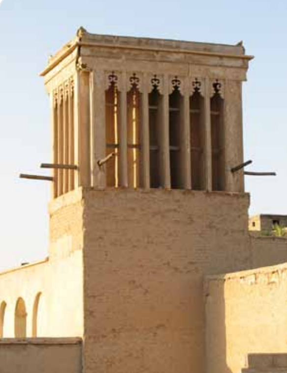
بادگیر