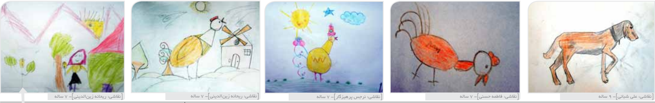
نقاشی: ریحانه زین الدینی - ۷ ساله