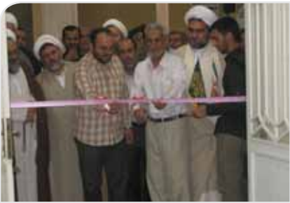
افتتاح ستاد انجیا به معروف و نبی از منکر