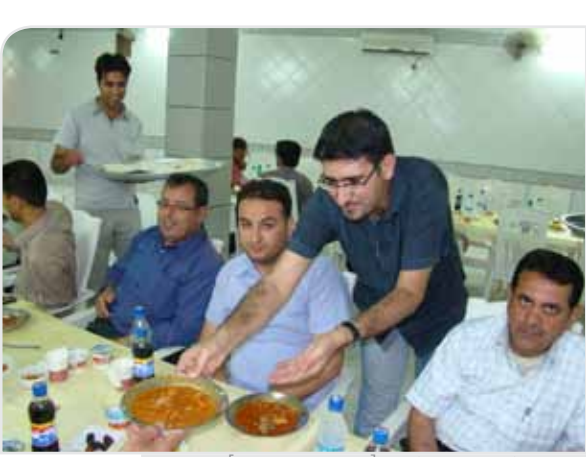
افطاری خبرنگاران و روزنامهنگاران