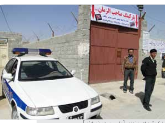
پارکینگ صاحب‌الزمان

بروید و خلافی موتور را بگیرید. در مواردی سری هم باید به شورای حل اختلاف بزنید. اگر موتورتان پلاک نداشته باشد امضای تعهد به نرخ امروز حدود ۲۰ هزار تومان پایتان آب می‌خورد. خلاصه چند وقتی را سرگرم هستید. بعضی وقت‌ها وقت‌گیر بودن این مراحل به گونه‌ای است که برخی افراد در ازای دریافت پول حاضر به انجام این کارها هستند. سرهنگ انصاری درباره این افراد می‌گوید: اگر کسی از پرسنل ما پیشنهادی در این باره داده باشد و یا فردی بدون طی کردن مراحل قانونی موفق به خروج خودرو و توقیفی از پارکینگ شده کافی است نام او را در اختیار ما قرار دهید تا به مراجع قضایی تحویل داده شود.