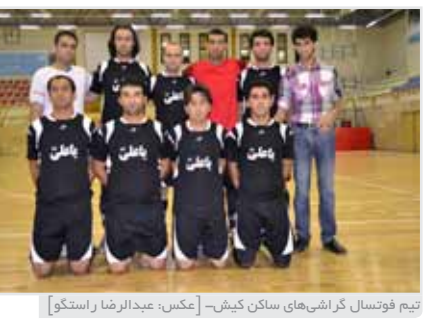
تیم فوتسال کرمانی‌های ساکن کیش