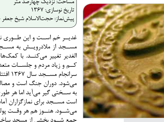
[عکس: محمدامداد نوبهار]

مسجد هستند. وقت نماز همیشه می‌شود صدای «یاالله» کسی را شنید که کار مشتری آخر وقت‌اش را سریع راه انداخته است تا خود را به نماز برساند. به خاطر همین رکوع‌ها کمی طولانی‌تر از معمول است. کفش‌ها نیز دم ورودی کوچک مسجد روی هم تلباز شده است. در مسجد خبری از زن‌ها نیست. مسجد بیشتر دست‌چون‌ها است و حتی همیشه ردیف اول را هم باید جوان‌ترها تکمیل کنند. جوان‌ترها قبل از اذان مغرب بساط افطار را آماده می‌کنند. اتاقک شیشه‌ای کنار محل سفره است و اگر پولی جمع شده باشد بساط نخود بین دو نماز به راه افتاد این کارها را بیشتر