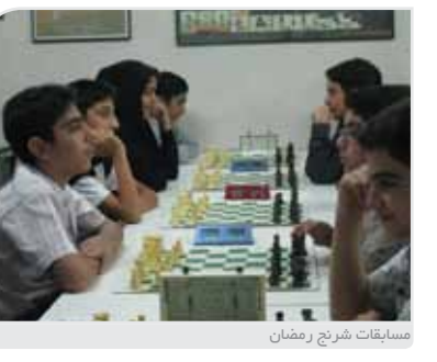
مسابقات شرح رمضان