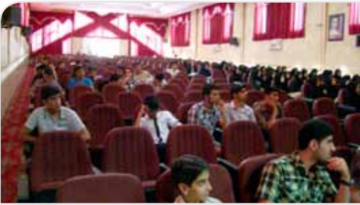
جلسه کنکوری‌ها در سالن سرانج