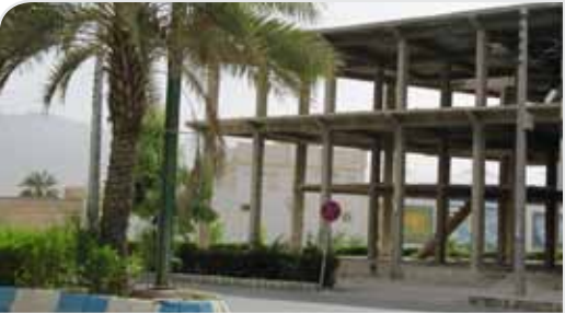
قدیمی‌ترین ساختمان نیمکمره کر اش

مشکل داریم. اگر اهل اینترنتن هستید نسخه الکترونیکی نشریه را برای‌تان می‌فرستیم تا زمانی‌که راه حلی برای اشتراک در دبی پیدا کنیم.