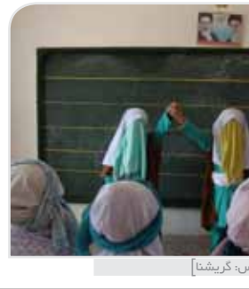
همایش بسیجیان در مدرسه علمیه چهارده مصوم