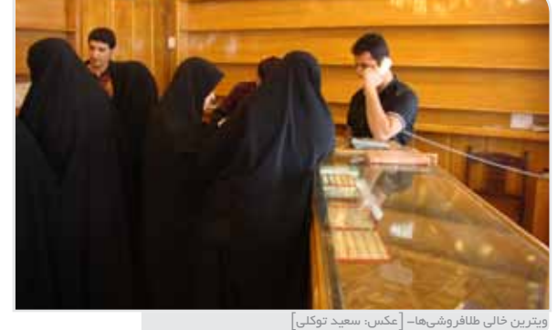
ویرین خانی طاهر و شی‌ها- [عکس: سعید توکل]

از اواخر آبان‌ماه طلافروشی‌های شهر طلای ۲۱ خود را از ویتترین جمع کردند. با اعلام خبر جمع‌آوری طلاهای خارجی از تلویزیون، طلافروشی‌های گرایش طلاهای خود را از ویتترین جمع کردند تا جای خالی درخشش