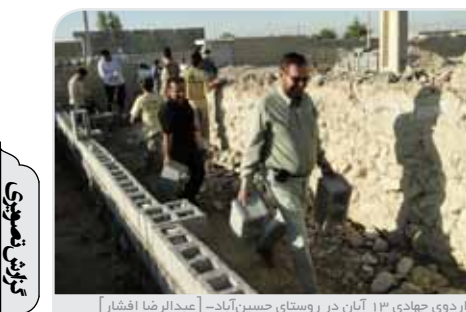
اردوی جهادی ۱۳ آبان در روستای حسین آباد - [عبدالرضا افشار]