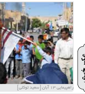
راهپیمایی ۱۳ آبان