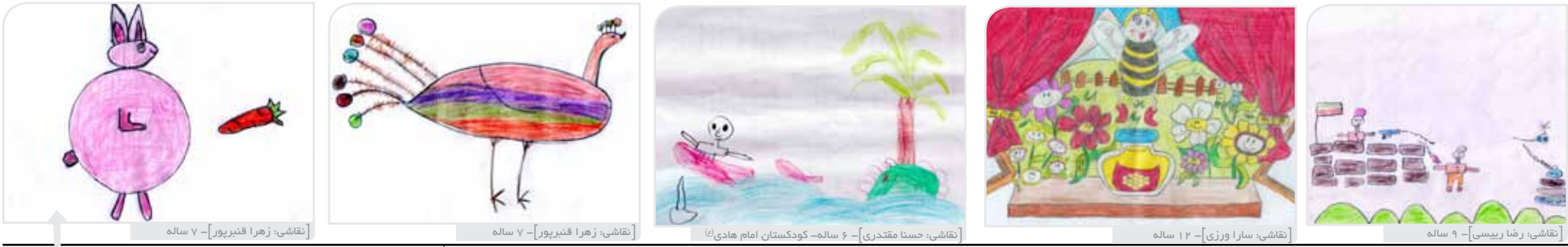
نقاشی: زهرا قنبرپور - ۷ ساله