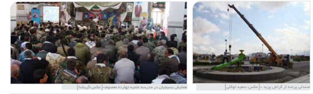
همایش بسیجیان در مدرسه علمیه چهارده مصوم