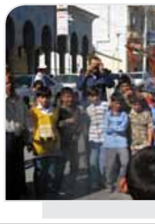
جشن عید غدیر در مدرسه کریمیان- [عکس: کریمش]