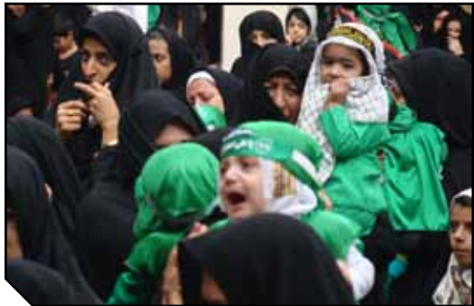
مراسم شیرخوارگان حسینی در حسینیه ولیعمر(ع)