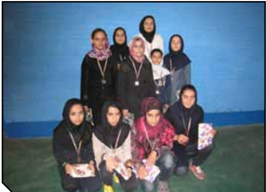
شرکت‌کنندگان مسابقات پیکنگ دختران فارس