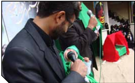
مراسم شیرخوارگان حسینی در حسینیه ولیعمر(ع)