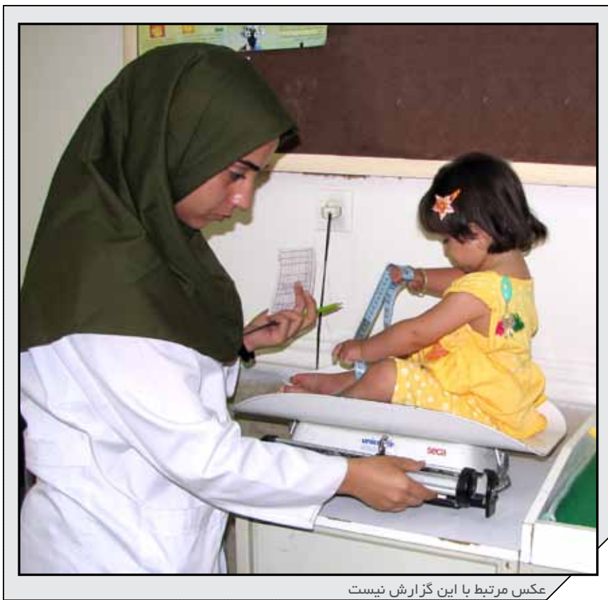
عکس مرتبط با این گزارش نیست