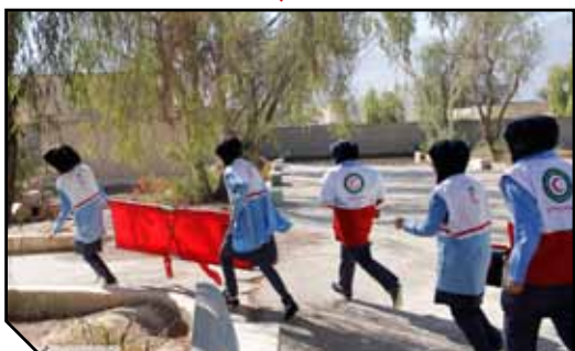
برگزاری مانور زلزله در دبیرستان کوثر