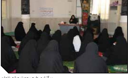
برگزاری طرح رحمت ویژه بانوان