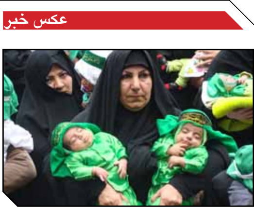
مراسم شیرخوارگان حسینی در حسینیه ولیعمر(ع)