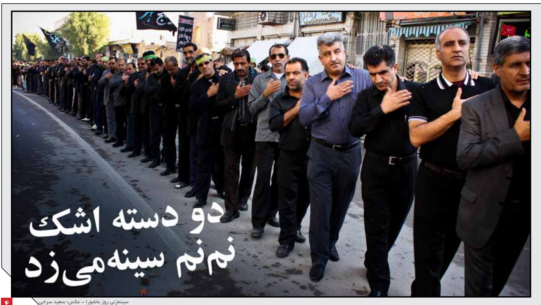
سینه‌زنی روز عاشورا

در سفر رییس جهاد دانشگاهی به گراش توافق شد