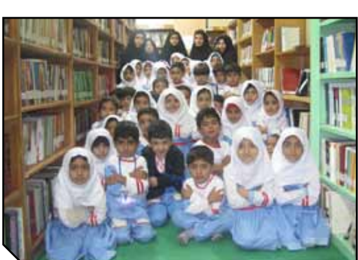
بچه‌های مهدکودک هلال‌احمر به مناسبت هفته کتاب به کتابخانه رفتند