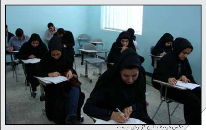
عکس مرتبط با این گزارش نیست