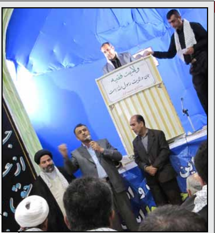
جعفرپور در نماز جمعه گراش

برای اداره ثبت اسناد اشاره کرد. او گفت که برای دانشکده علوم پزشکی گراش نیز پیگیری کرده و به وزیر مراجعه شده است. جعفرپور گفت: «رشد گراش، رشد لار است. اگر این اوضاع باشد همان گرفتاری که دو سال برای لار پیش آمد، چهار سال برای گراش اتفاق می‌افتد.» درباره پلیس ۱۰+ جعفرپور گفت: «نامه‌های ما برای پیگیری موجود است. در دیدار با فرمانده نیروی انتظامی گفته شد که سهمیه‌ای به گراش تعلق نمی‌گیرد اما من این مساله را نپذیرفتم. انشاءالله به دنبال آن هستیم و دارم مجدد پیگیری می‌کنم.» یکی از سوالات درباره جمع شدن تابلوی پارک جنگلی شهرستان بود. سوالی که در میان موج سوال‌های مطرح شده گم شد.