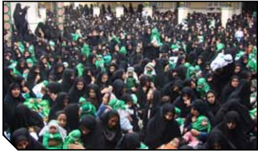
مراسم شیرخوارگان حسینی در حسینیه ولیعمر(ع)