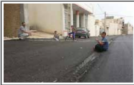
«آسفالت تازه خیابان دروازه با شیب بیش از حد مناسب»