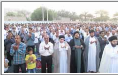
ستاد نماز جمعه ارد در میان ستادهای برگزیده کشور قرار گرفت