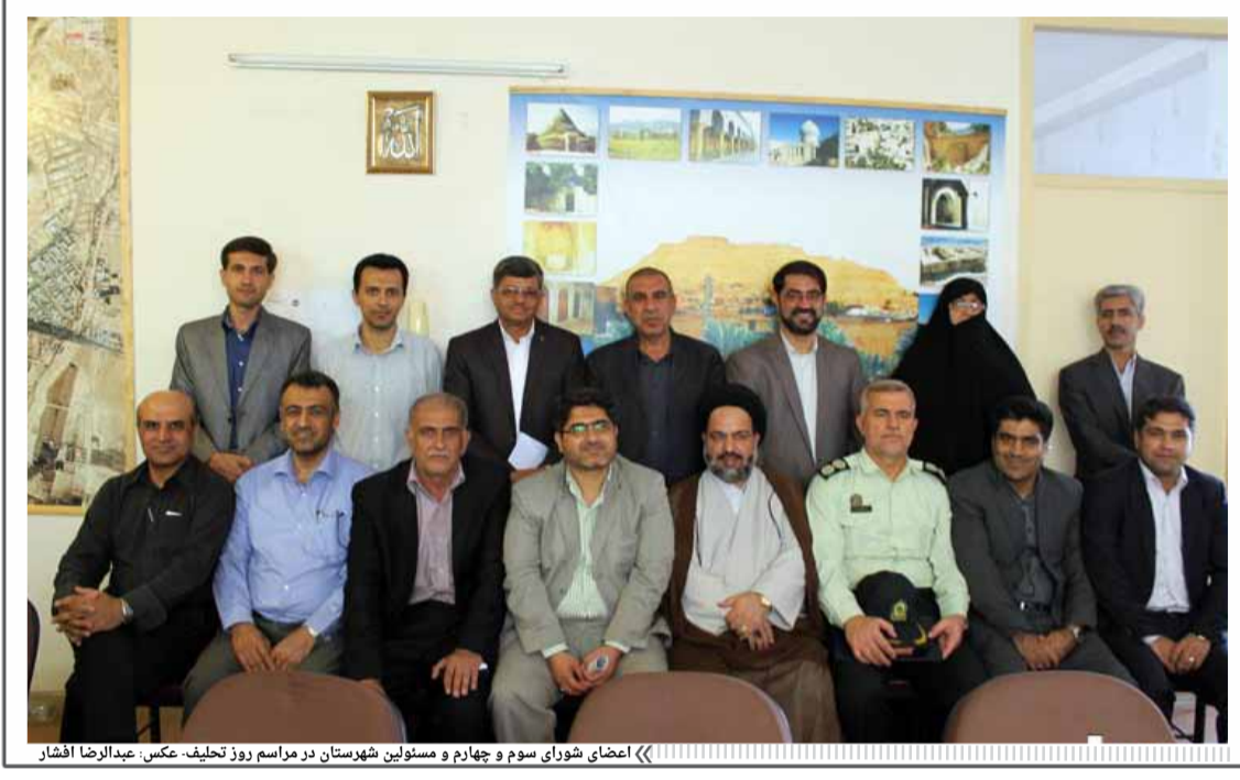
«اعضای شورای سوم و چهارم و مسئولین شهرستان در مراسم روز تحلیف. »