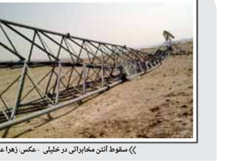
«سقوط آنتن مخابراتی در خلیلی»