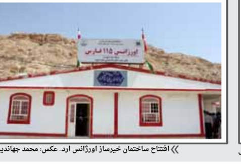
«افتتاح ساختمان خیرساز آوزانس ارد.»