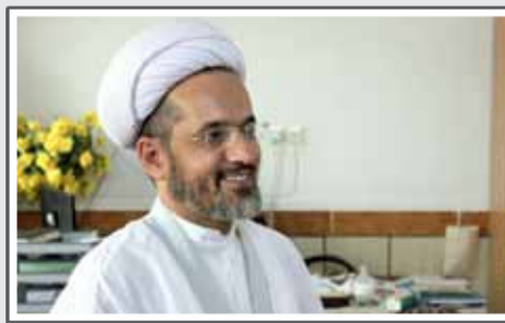
حجت الاسلام رجیبی رییس حوزه علمیه باقرالعلوم (ع)