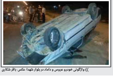
«واگونی خودرو عروس و داماد در بلوار شهدا. عکس: باقر شکاری»