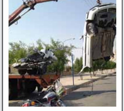
«مرصاد افشار- ماشین نصفه»