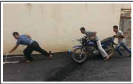
«سرعت‌گیر کاملا طبیعی»