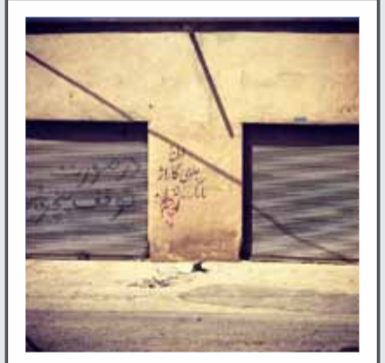
«رضا مهربانی- گذر»