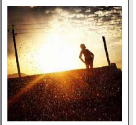
«mali_tavakoli - تابستان»