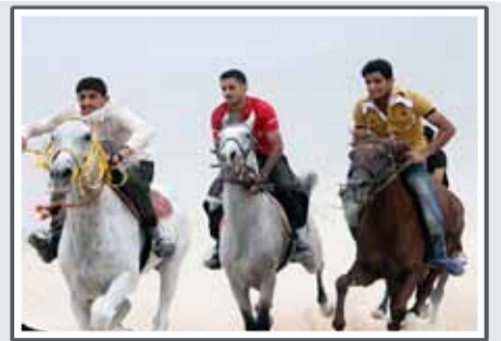
کورس اسب سواری