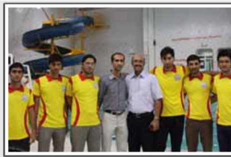
شش گراشی مرین شنا شدند.