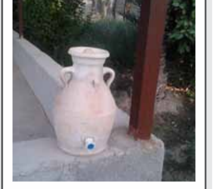
«نوریه بلبل- ترکیب سنت و راحتی»