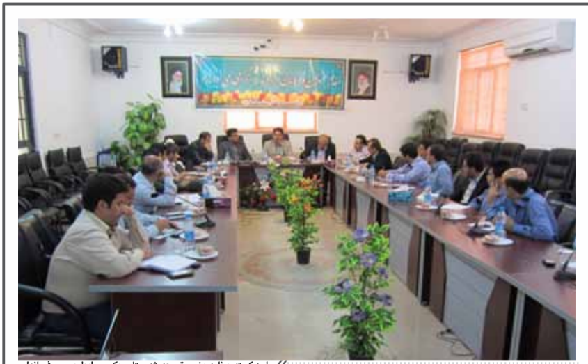
جلسه کمیته برنامه‌ریزی و توسعه شهرستان

تجهیزات و تعمیر مدارس، اعتبار ۱۹۵ میلیون تومانی اصلاح و احیا باغات میوه و تولید و افزایش گل و گیاه زینتی، اعتبار ۱۰۹ میلیونی ایجاد شهرک‌ها صنعتی شهر گراش ارقام قابل توجه بودجه ادارات شهرستان است. بخشی از اعتبارات نیز اختصاصاً برای پروژه‌های روستایی تعریف شده است از جمله اعتبار ۵۱۳ میلیون تومانی احداث راه‌های روستایی و پروژه‌های راهداری راه و شهرسازی، اعتبار ۲۶۴ میلیونی ابفا روستایی و اعتبار ۱۷۶ میلیونی طرح‌های عادی بنیاد مسکن