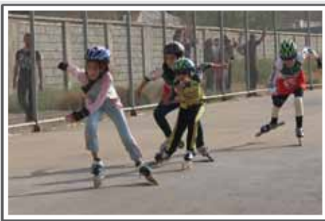
۱۲ مدال دختران اسکیتباز در جام دولت شیراز