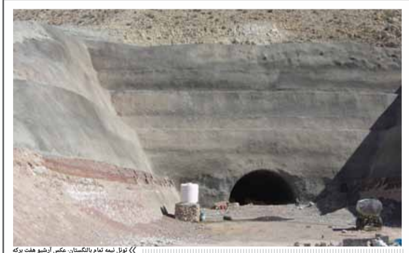
تونل نیمه تمام بالنگستان،