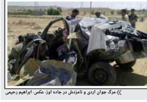
«مرگ جوان اردی و نامزدش در جاده اوکس.»