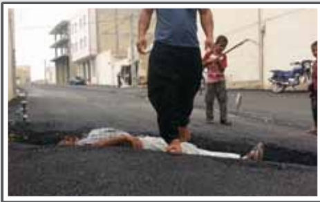
«خندق با عمق بسیار مناسب»