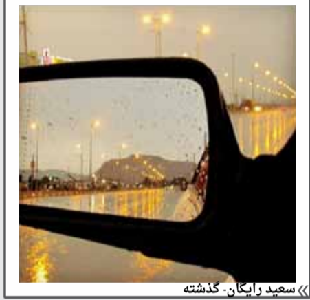
« سعید رایگان - گذشته »