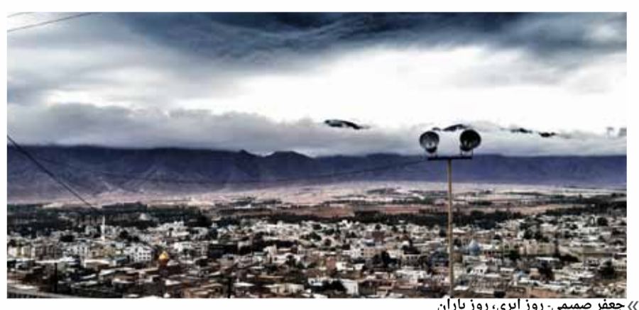
« جعفر صمیمی - روز آبری، روز باران »