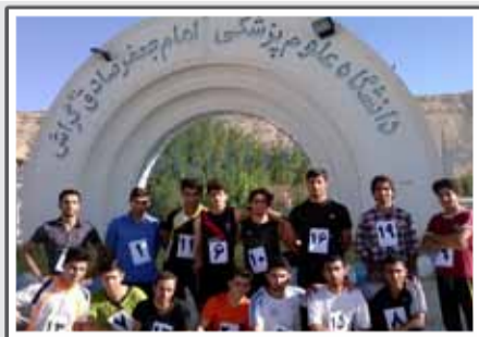
مسابقه دو دانشجویان به مناسبت عید غدیر