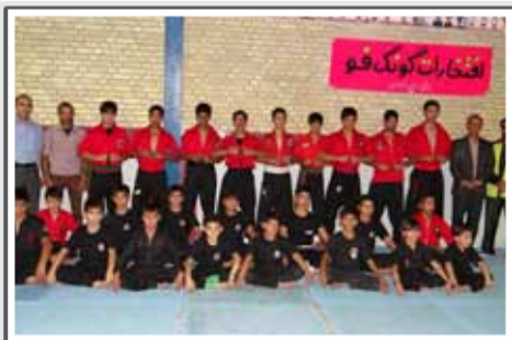
تقدیر از مدال آوران کوکوفو