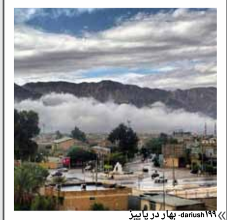
« ۱۹۹۹ داریوش - بهار در پاییز »