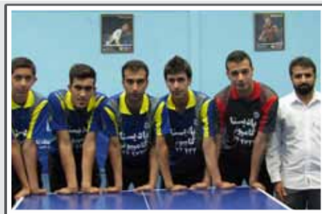
ستاره آبی در گروه یک لیگ برتر پینگپنگ استان اول شد