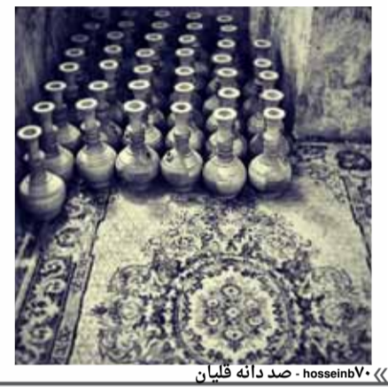
« ۷۰ hoseinb - صد دانه فلین »