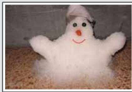
پاروش تکرک و ساخت آدم تکرگی.