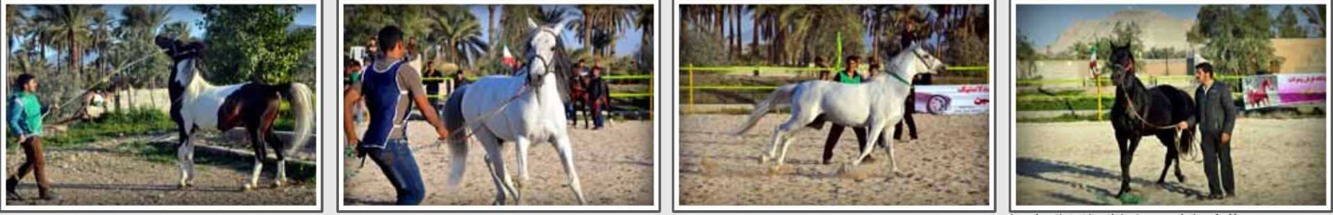
«عکس‌های امیرحسین نوبهار از مسابقه زیباترین اسب‌ها»