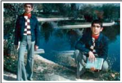
دوران دبیرستان در شیراز