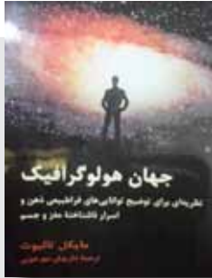
جلد کتاب جهان هولوگرافیک

«اشاره به توانایی‌های فراطبیعی ذهن و اسرار ناشناخته‌ی مغز