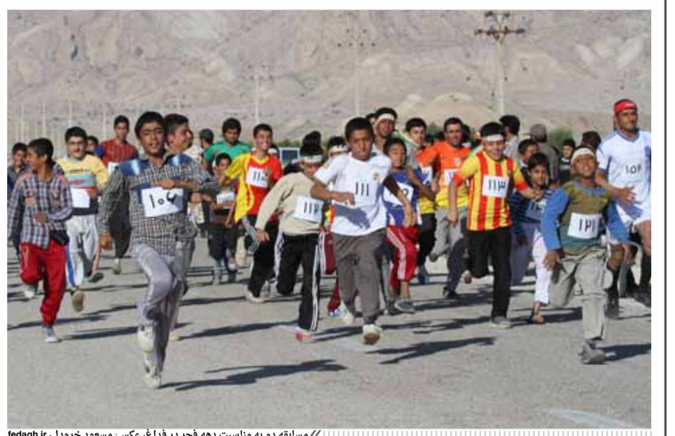
مسابقه دو به مناسبت دهه فجر در فداغ،