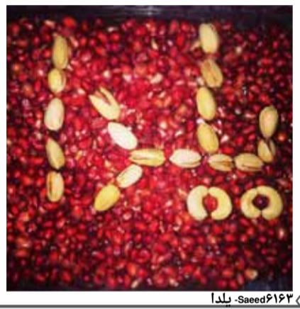
« Saed61۶۳ - سدا »