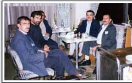
جلسه خیرین مدرسه‌ساز در تهران