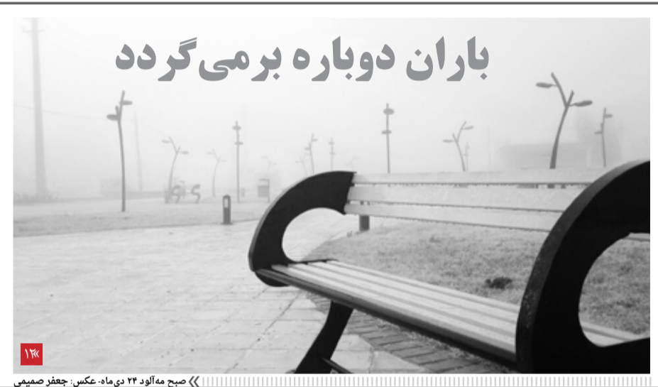
صبح مه‌آلود ۲۴ دی‌ماه.