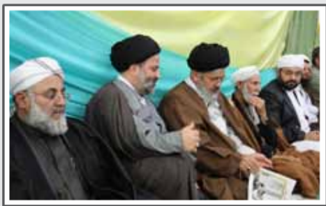
جشن هفته وحدت در مسجد امام زین العابدین (ع).