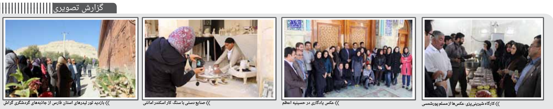
« بازدید تور لیدرهای استان فارس از جاذبه‌های گردشگری کرمان » « صنایع دستی با سنگ کار اسکندر امانتی » « عکس یادگاری در حسینیه اعظم » « کارگاه شیرینی‌پزی »