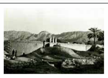
« برای بعد »