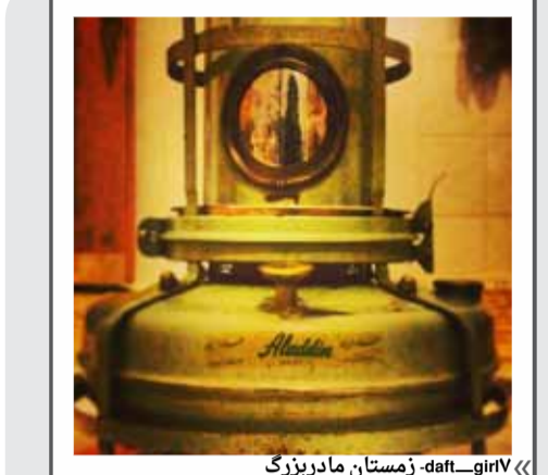
« daff-girliv - زمستان مادر بزرگ »