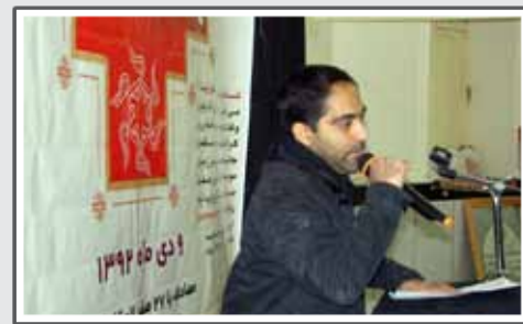
شب شعر پیامبر اعظم (ص) در مسجد حضرت خدیجه س.