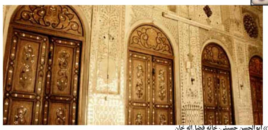
« ابوالحسن حسینی - خانه فضل اله خان »