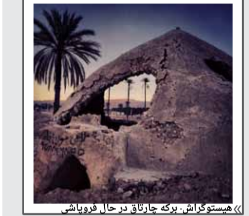
« هیستوگراش - برکه چارتاق در حال فروپاشی »