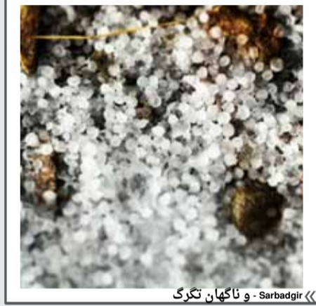
« Sarbadgir - و ناگهان تنگ »