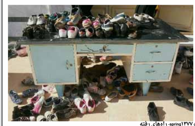
« spring1۳۷۷ - راه‌های رفته »