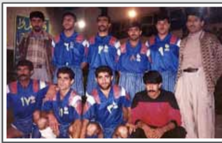
تیم فوتبال ستاره آبی قهرمان لارستان ۱۳۷۷