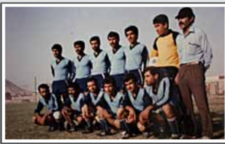
تیم بزرگسالان ستاره آبی در سال ۱۳۶۵