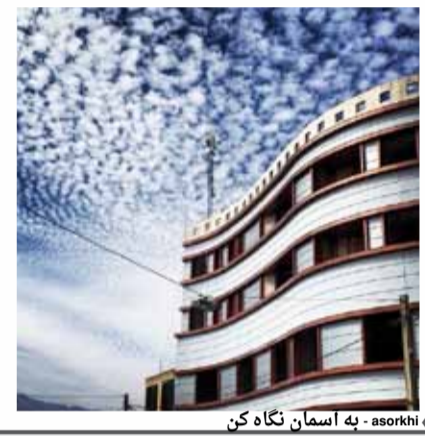
« asorkhi - به آسمان نگاه کن »