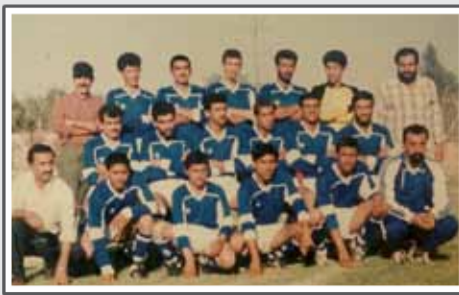
تیم بزرگسالان ستاره آبی در سال ۱۳۶۸