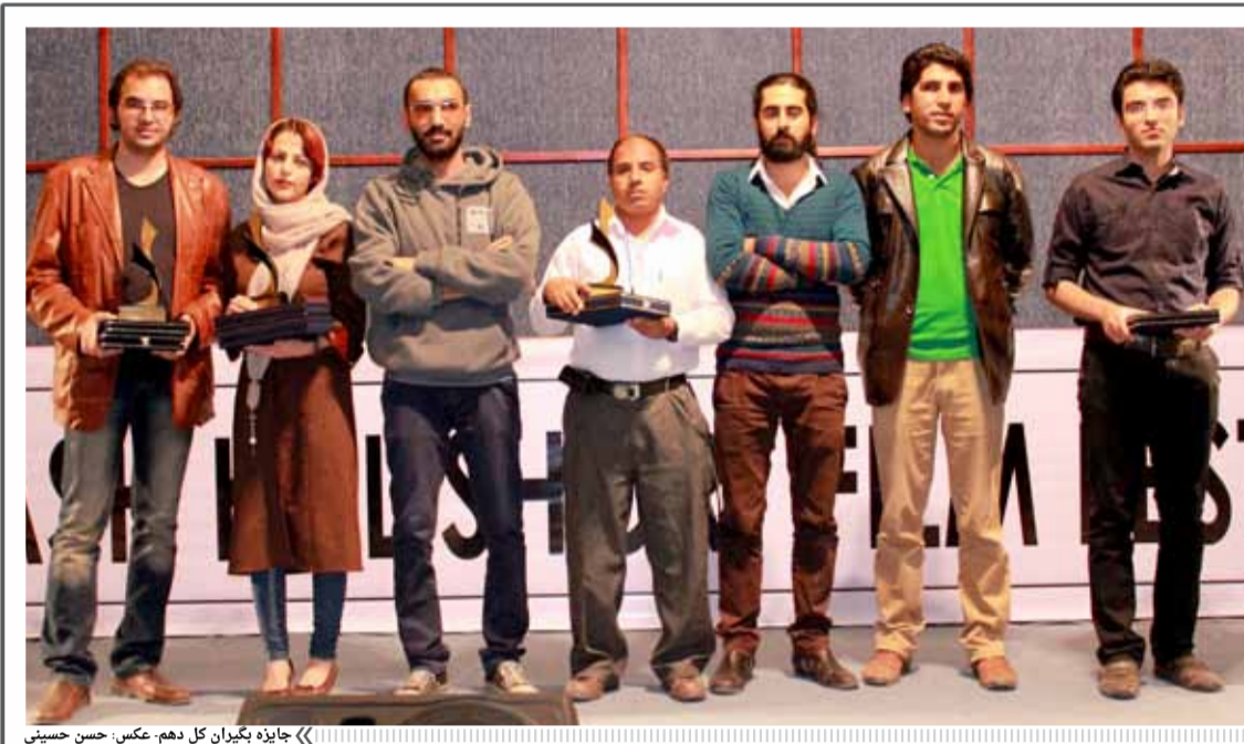
«جایزه بگیوان کل دهم، عکس، حسن حسینی»