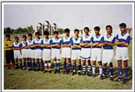
تیم نوجوانان ستاره آبی در سال ۱۳۸۰