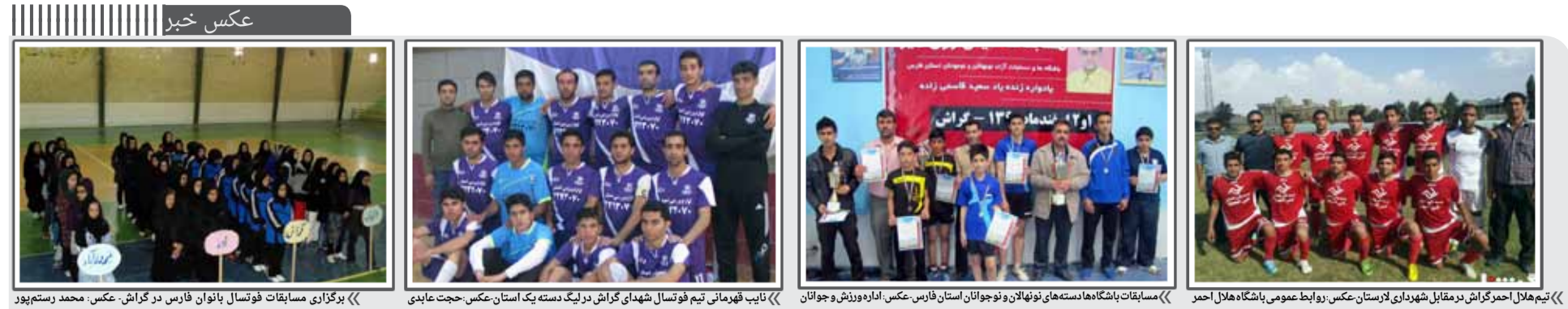
«تیم هلال احمدگراش در مقابل شهدای لارستان» «مسابقات باشگاهها دسته های نونهالان و نوجوانان استان فارس» «تایپ قهرمانی تیم فوتسال شهدای گراش در لیگ دسته یک استان» «برگزاری مسابقات فوتسال بانوان فارس در گراش»