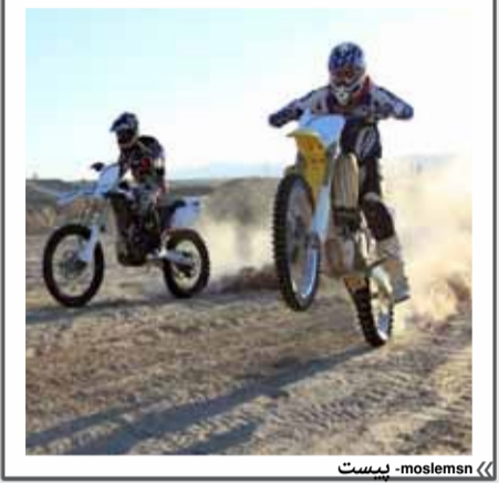
« moslemin - بیست »