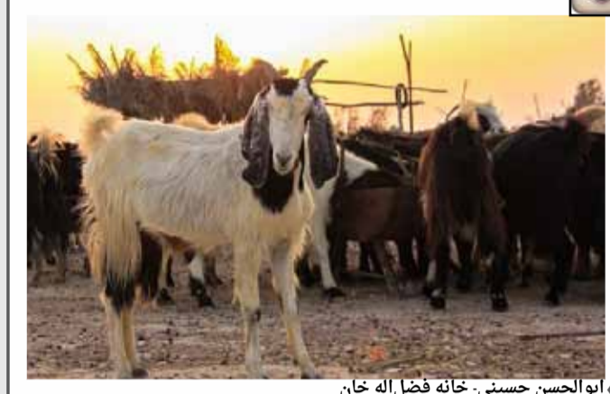
« asorkhi - به آسمان نگاه کن »