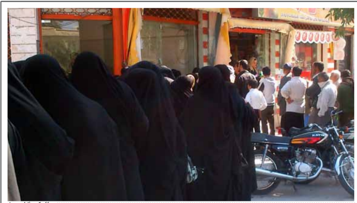
عکس: فاطمه یوسفی

تمام سرعتی که می‌شد داشت پرسیدیم؛ مشکلی برای توزیع ندارید؟ جواب می‌دهد: «در این حوزه مشکلی نداریم تنها مساله، سر وزن کردن مرغ است از بعضی‌ها که پول می‌گیریم می‌پرسند چرا باید پول بدهیم؟ از طرف دیگر چولنگوی سوال‌های افرادی که لوبیا یا ماهی به سبد کالای آن‌ها اضافه می‌شود هم باید باشیم.»