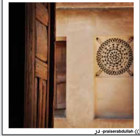
« praiserabdullah - در »