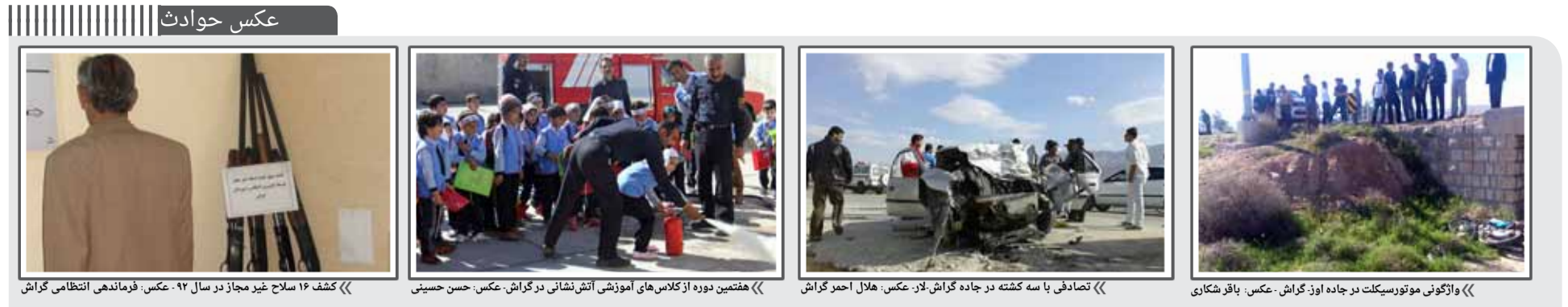
«عکس یادگاری در کنار نقاشی شهید محمد حسن زاده در نزدیکی خیابان آبیاری» «تصادف با سه کشته در جاده گراش-لار.» «مقتضین دوره از کلاس‌های آموزشی آتش‌نشانی در گراش.» «کشف سلاح غیرمجاز در سال ۹۲.» «واژگونی موتورسیکلت در جاده اوز-گراش.»

افسانه شما تلفن و فاکس: ۰۷۸۲۰ ۲۲۲۹۹۷۰ پیامک: ۰۹۳۷۴۹۰۹۶۰۰ info@gerishna.com