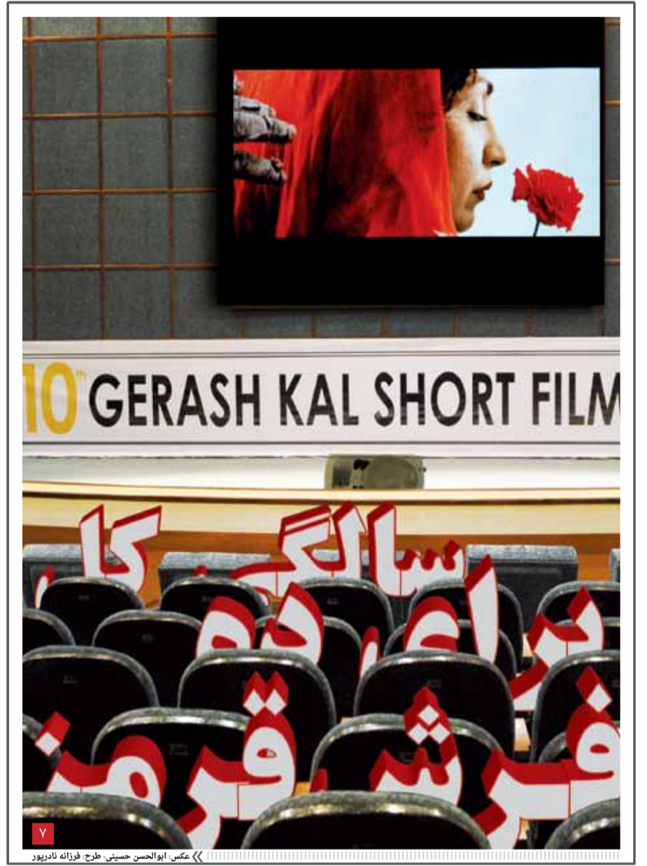
طرح: فرزانه تادریور

نوجوانان متولد دهه هفتاد مسعود محسن زاده را با مدیریت مدرسه راهنمایی