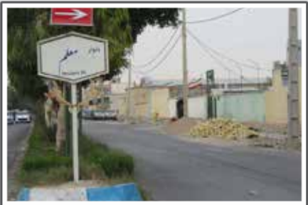
«بلوار معلم همچنان تیره‌تمام»

سال موفق برای کنکوری‌های ریاضی، انسانی و هنر