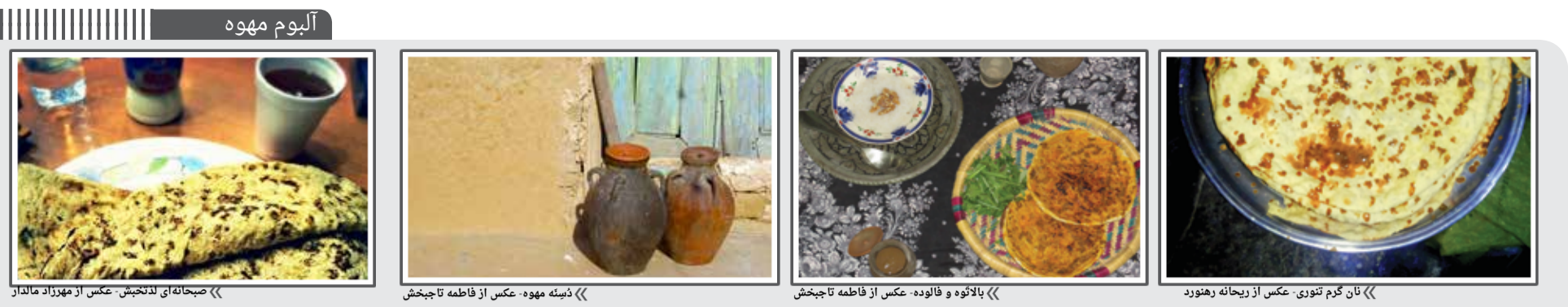
«صبحانه‌ای لذیذ»