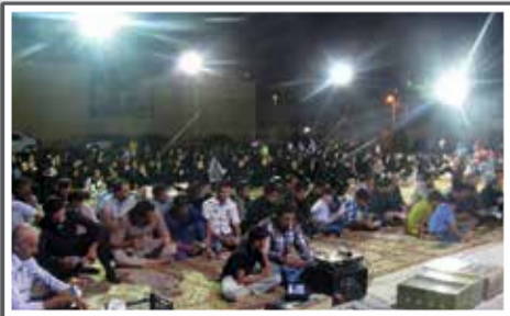
«برگزاری مراسم شب‌های قدر در فضای باز شهرک پردیس»