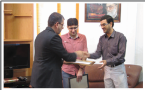
«تقدیر فرماندار از خیرنگاران گراش.»

گریشنا: با فعال شدن کمیته فنی شهرستان، همکاری بین مهندسان نظام مهندسی و مجموعه فرمانداری و ادارات شهرستان در زمینه ساخت‌وسازها و اجرای پروژه‌های عمرانی تسهیل می‌شود. جلسه کمیته فنی شهرستان گراش با حضور فرماندار، شهردار، روسا و نمایندگان شورا و ادارات و همچنین نمایندگان نظام مهندسی گراش، چهارم مردادماه در ساختمان فرمانداری برگزار شد. اصغر فرودی، فرماندار گراش و رییس کمیته فنی شهرستان، ضمن تشریح وظایف کمیته بر این نکته تاکید کرد که نظارت دقیق و مهندسی بر اجرای پروژه‌های عمرانی باعث اجرای صحیح و سریع ساخت‌وسازها، جلوگیری از هدررفت سرمایه‌های ملی و افزایش مدت زمان بهره‌برداری از آنها می‌گردد، و این وظیفه همه است که به سهم خود بر اجرای پروژه‌ها نظارت داشته باشند. بعد از صحبت‌های فرماندار، حاضرین در جلسه نیز به بیان دیدگاه‌های خود پرداختند. چند مصوبه نتیجه این بحث و تبادل نظر بود، از جمله این که در مدت یک ماه آینده، از معادن و کارگاه‌های تولید مصالح ساختمانی سطح شهرستان و همچنین از پروژه‌های عمرانی بازدید به عمل آید؛ تیرچه‌های تولید شده در کارگاه‌های سطح شهرستان دارای تاییدیه مهندس ناظر باشد.