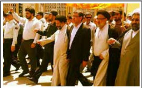
«راهپیمایی روز قدس.»