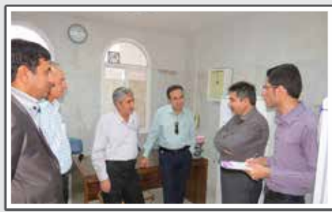
برگزاری مراسم اجرای واکسیناسیون پستانلان