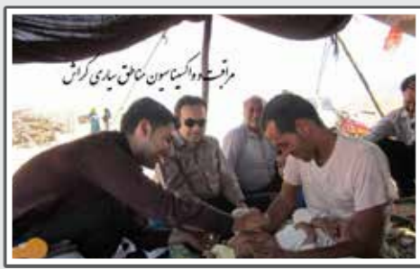
انجام عملیات واکسیناسیون روتان و اجرای طرح تکمیلی نظاره قطع اطفال