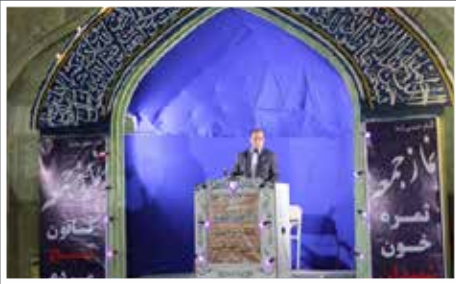
«تشریح دستاوردهای طرح تحول نظام سلامت در نماز جمعه