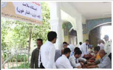
«برپایی ایستگاه سلامت برای نمازگزاران