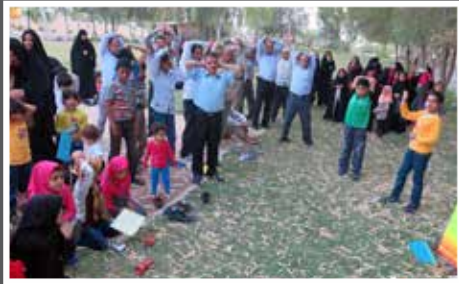
«پیداهروی سالمندان در هفته سلامت