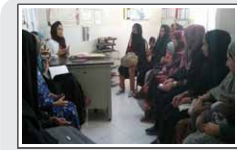
گزارشگر روز جهانی جمعیت