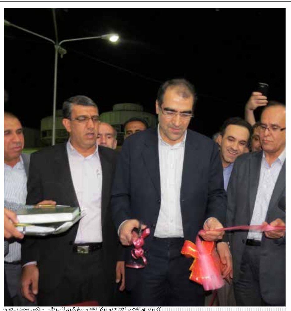
وزیر بهداشت در افتتاح دو مرکز MRI و پیش گیری از سرطان