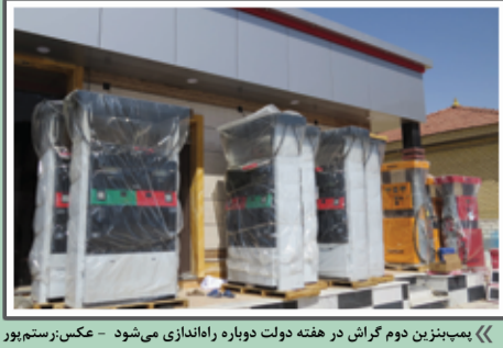
«همپنژین دوم گراش در هفته دولت دوباره راهاندازی می‌شود»