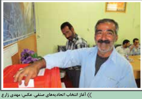
«آغاز انتخاب انجاده‌های سنی»