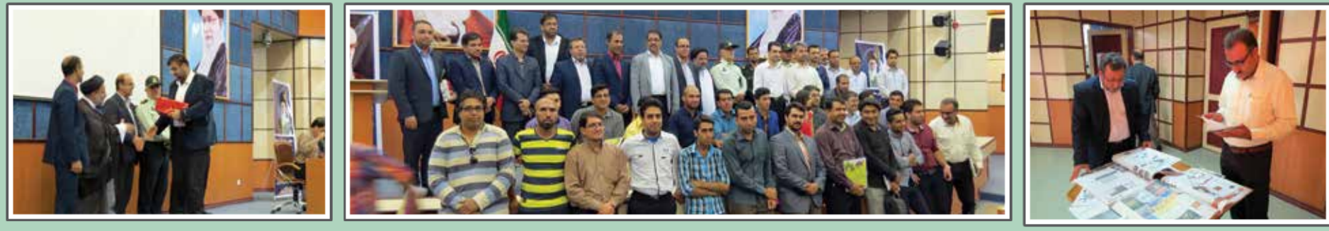
گزارشی از مرکز انتقال خون گراش به مناسبت روز انتقال خون