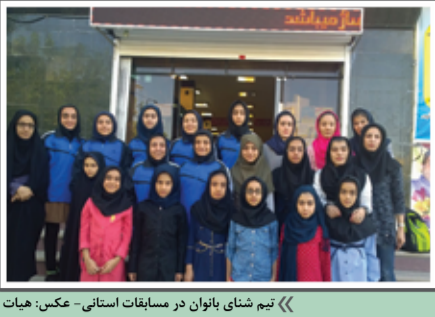
«تیم شای بانوان در مسابقات استانی»