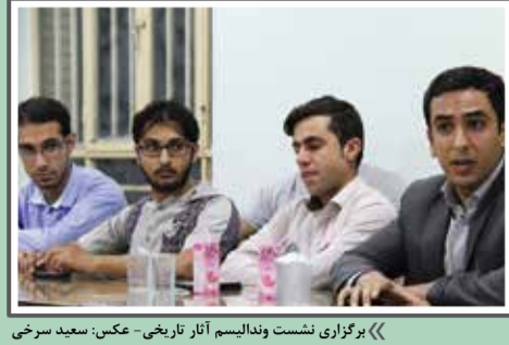
«برگزاری نشست وندالیم آثار تاریخی»