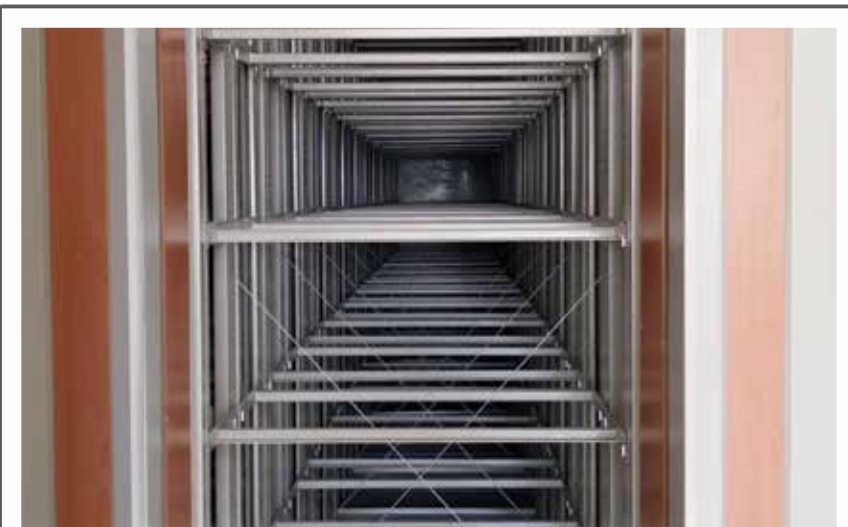
یابانی سرانیزه اداره امور مالیاتی

شش. مردم می گویند که اطلاع رسانی در اداره دارایی بعضاً گزینشی است و مواردی که در قانون آمده است و به نفع سازمان مالیات است، این اداره با مردم مطرح می کند اما مواردی که به ضرر آن ها است را مطرح نمی کند. به طور مثال در بحث معافیت مالیاتی موارد بسیار زیادی وجود دارد که مردم از آن آگاهی ندارند؛ این که اگر دو نفر در یک واحد صنفی شریک باشند می توانند تا بیست میلیون تومان (برای دو نفر) از مالیات معاف باشند. و یا این که اگر شخصی در طول سال خسارت دید (نظیر تصادف) و تا مدتی نتوانست سر کار برود، می تواند از بخشی یا تمام مالیات آن سال معاف شود. و همین طور واحدهای صنفی که وانت دارند نیز از پرداخت مالیات و انت معاف هستند.