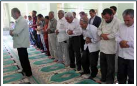
«فرماندار در روستای آغمه»