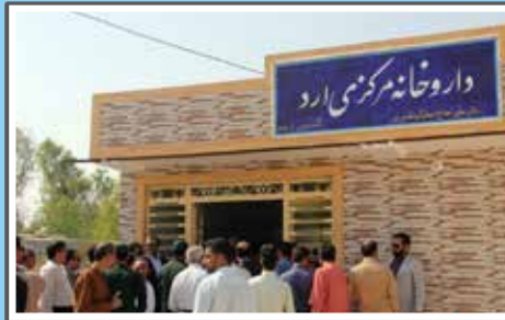
«افتتاح داروخانه و مرکز دندان پزشکی خیرسا ارد»