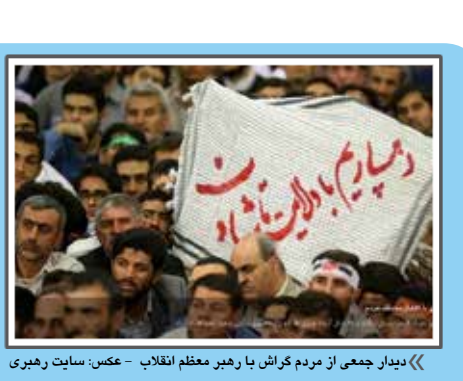
دیدار جمعی از مردم گراش با رهبر معظم انقلاب