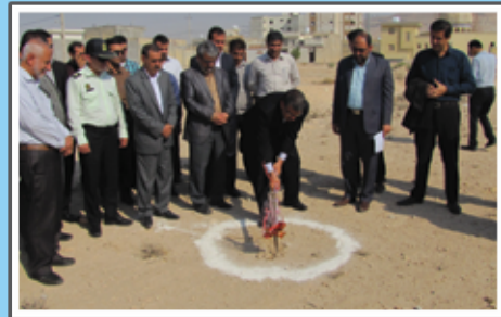
«کلنگ‌زنی مدرسه عظیمی در شهرک فرهنگیان»