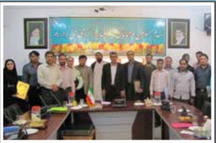
«کارمندان نمونه شهرستان»