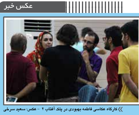
کارگاه عکاسی فاطمه بیهودی در پلک آفتاب - ۲