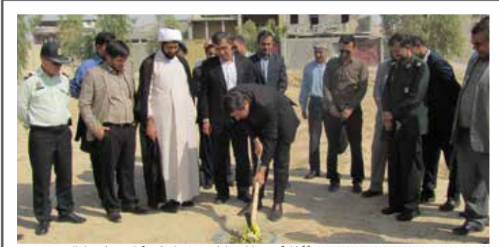
«کلنگ‌زنی پارک سلمانی در شهرک فرهنگیان»

درویشی، مدیر اداره‌ی آموزش و پرورش شهرستان نیز بعد از خیر مقدم به دست‌نیا در این مراسم بیان کرد: «از آن‌جا که تمرکز