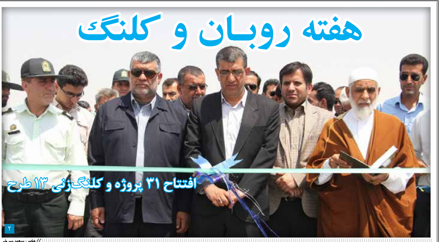
افتتاح ۳۱ پروژه و کلنگ‌زنی ۱۳ طرح

از پروژه‌های مهم دیگر هفته دولت کلنگ‌زنی ساخت پروژه مسکونی خودمالکی مسکن ۲۲۰ واحدی ولی عصر (عج) بود. برای ساخت این ۲۲۰ واحد چهار و نیم میلیارد هزینه پیش‌بینی شده است. فرماندار گفت: «پروژه ساخت ۲۲۰ واحد مسکونی خودمالکی در زمینی به مساحت دو و نیم هکتار کلنگ‌زنی شد و در این طرح ۷۰ خانوار تحت پوشش اداره بهزیستی و ۱۰ خانوار تحت پوشش کمیته امداد امام خمینی (ره) و ۱۴۰ خانوار دیگر به صورت آزاد صاحب خانه می‌شوند.» طرح پروژه آپارتمانی ولی عصر (عج) در شرق گراش و حاشیه شمالی بلوار خلیج فارس قرار دارد.