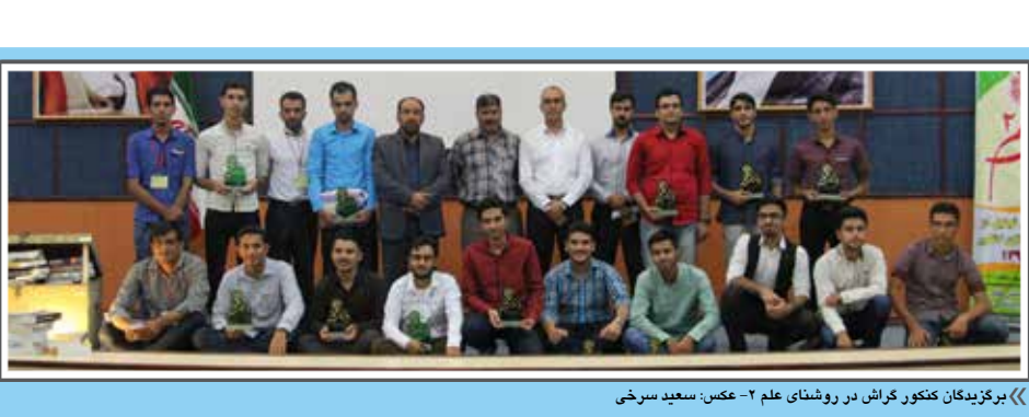
برگزاری کنکور گراش در روشناسی علم - ۲