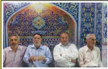
همه آمده بودند