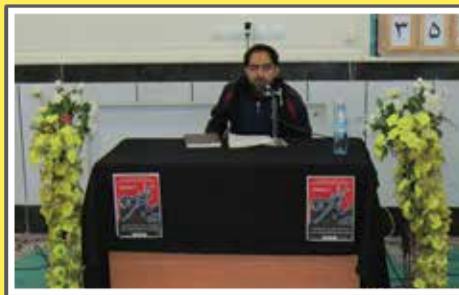
«آذر ۹۲- دومین شب شعر پیامبر اعظم(ص)»