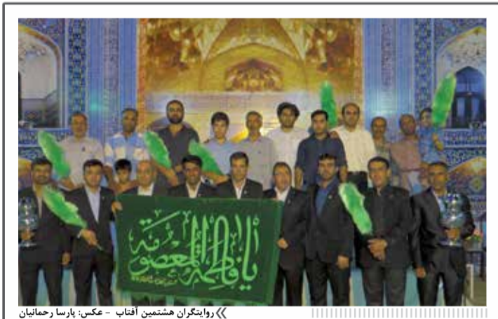
«روایتگران هشتمین آفتاب - عکس: پارسا رحمانیان»

چهار سال از فعالیت رسمی کانون فرهنگی و مذهبی روایت آفتاب می‌گذرد. این کانون اولین فعالیت خود را با افتتاح نمایشگاه عاشورایی روایت آفتاب در سال ۹۰ آغاز کرد. در این گزارش‌نگاهی داریم به فعالیت‌های که کانون روایت آفتاب در یک سال گذشته داشته است.