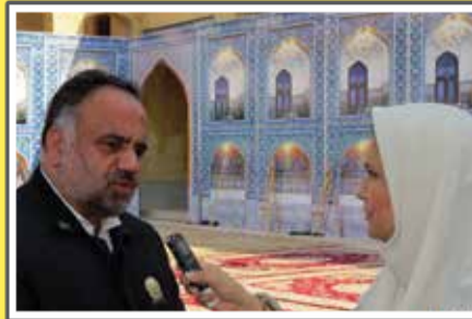
پخش گفتگوها از رادیو فرهنگ