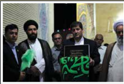
حمل پرچم حرم حضرت معصومه (س)