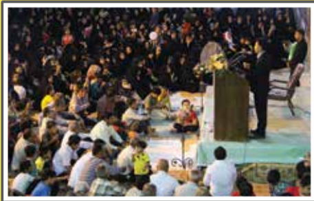
شب سوم حسینیة دریاپی از مشتاقان بود