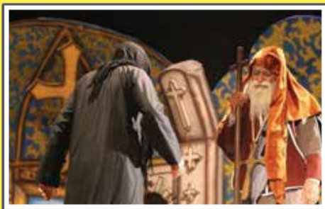
«آذر ۹۲- نمایش چشم در چشم فرات»