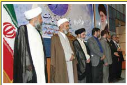
«پنجمین المپیاد قرآن و عبرت»