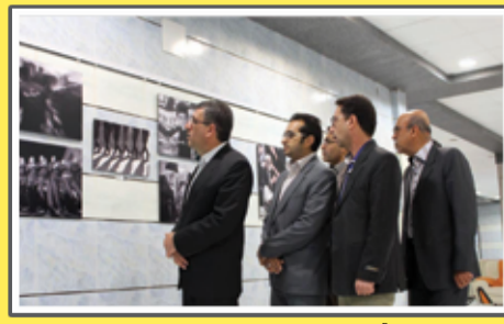
«آبان ۹۲- نمایشگاه عکس عاشورایی - عکس: مسلم پورشمسی»