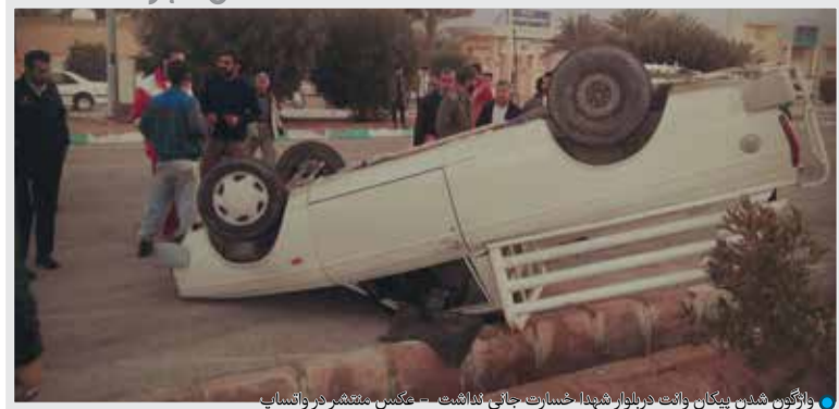
واژگون شدن پیکان وانت در بلوار جهاد، خسارت جانی نداشته