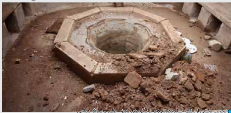
تخریب بخشی از سقف حمام دهبانی، در باستانی‌های پاییز

پورشمسی: با به هم ریختن اوضاع روابط ایران با کشورهای عربی خیلی از گراش‌ها ممکن است پولشان را برگردانند به ایران. آیا برنامه چیزی برای جذب این سرمایه‌ها و فعال کردن آن وجود دارد یا این که پول‌ها باید برود توی بانک بخوابد.