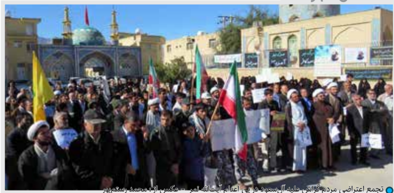
تجمع اعتراضی مردم گراش، علیه آل‌سعود در پی اعلام آیت‌الله فخر