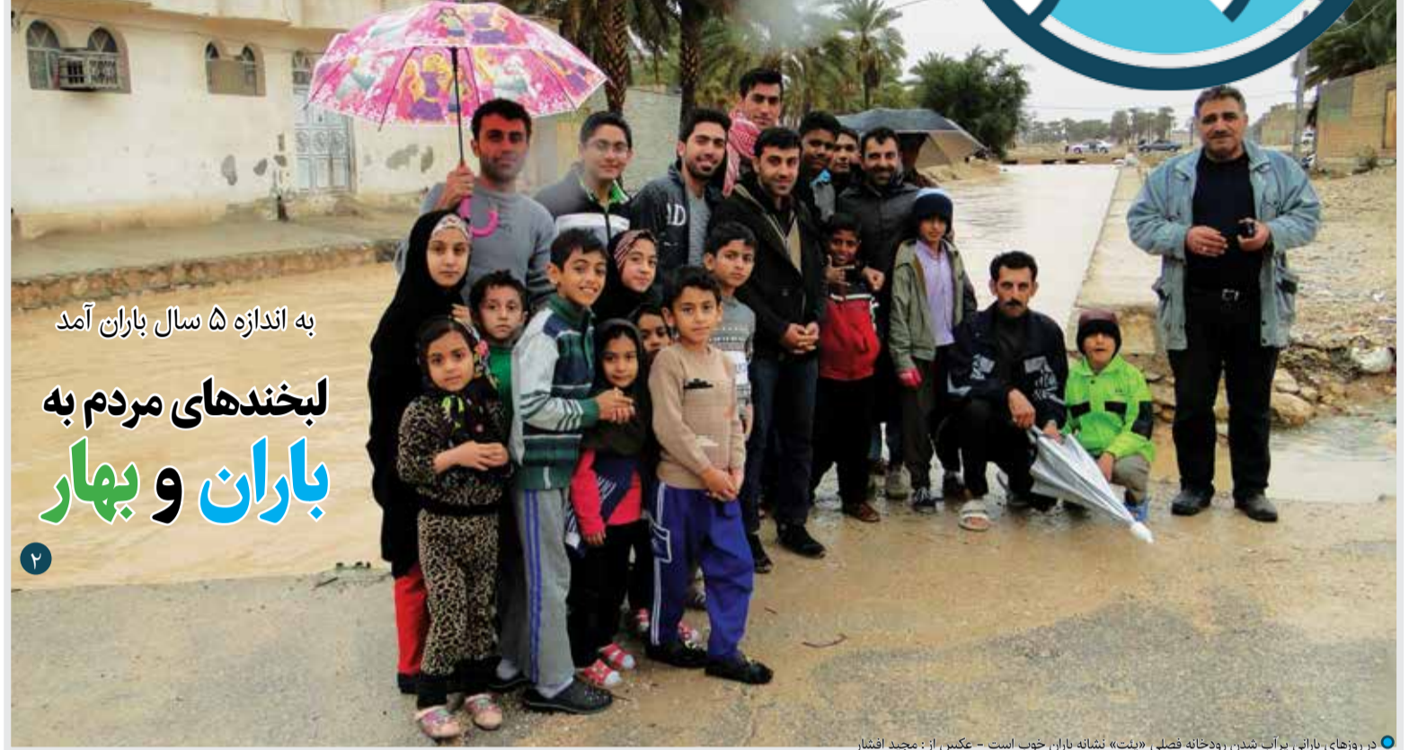
• در روزهای بارانی برآب شدن رودخانه فصلی «پنت» نشانه باران خوب است