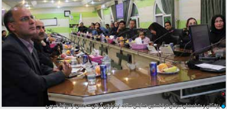
پژشکان و متخصصان سرخستان در نخستین همایش سالانه اونکوژنوی گراش