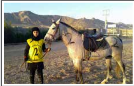
موفقیت سوارکاران گراشی در مسابقات برون شهری

فنی و حرفه ای در آزمایشگاه مرکزی راه اندازی می شود هفت برکه (گریشنا): مرکز آموزش فنی و حرفه ای با پیگیری فرمانداری و شورا به زودی در گراش راه اندازی می شود. هرمزی، سخنگوی شورای شهر در مورد همکاری نهادها در راه اندازی این مرکز جدید گفت: «پس از بحث و بررسی های مختلف، تصمیم گرفته شد تا مرکز آموزش فنی و حرفه ای شهرستان گراش در محل آزمایشگاه مرکزی استقرار یابد. همچنین قرار بر این شد تا شورای شهر و فرمانداری، مسئولیت تهیه ی ملزومات اداری؛ اداره کل آموزش فنی و حرفه ای تهیه تجهیزات کارگاهی؛ و اداره ی آموزش و پرورش شهرستان، فراهم کردن مکان برای راه اندازی این مرکز را به عهده گیرند.»