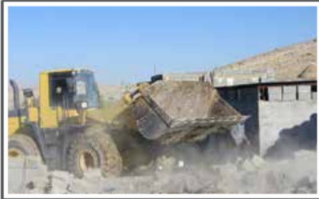
تخریب ساخت و سازهای غیر قانونی در تنگ لنگر