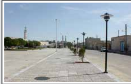
پارک ملتگردا