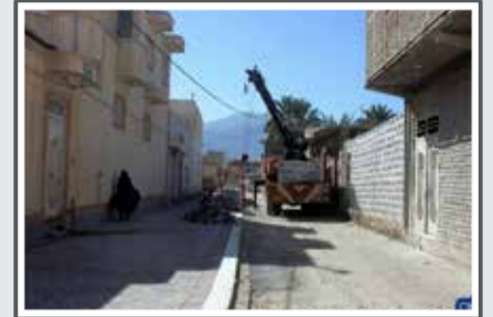
دامه سنگ فرش ۷ برکه برکه آنداله