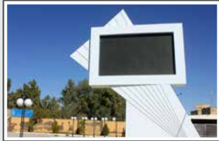
راه اندازی دومین تونلویز - شهری، عکس: ابوالحسن حسینی