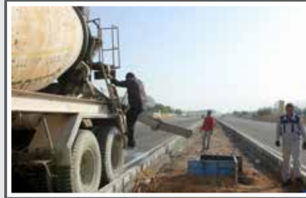
تختریزی روشنی بلوار خلیج فارس