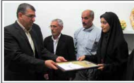
دیدار فرماندار با خانواده ی حافظان قرآن