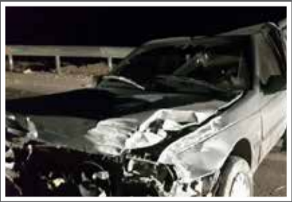
تصادف خودروی ۴۰۰۵ در گراش