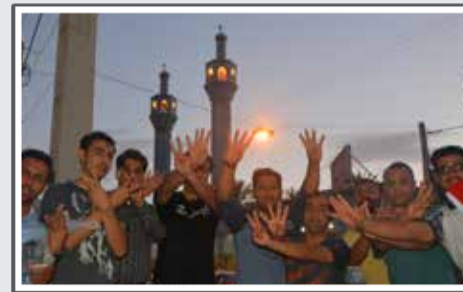
«شادی طرفداران پرسپولیس بعد از دربی - عکس هفت برکه»