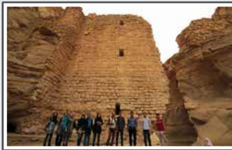
«تور گردشگری فهاغ»