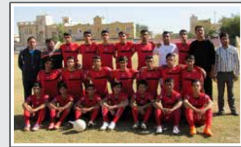
«دو قهرمانی و یک سومی کارنامه هلال احمر در سال ۹۲»