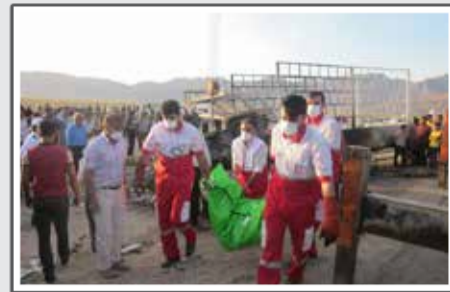
«مرکب هشت نفر بر تصادف چاده کهنه اوز»