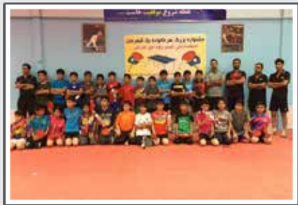
«چشواره استعدادیابی نخبس روی میز کران»