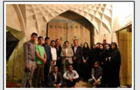
«مراسم اختتامیه خونه کبیرم ۲»