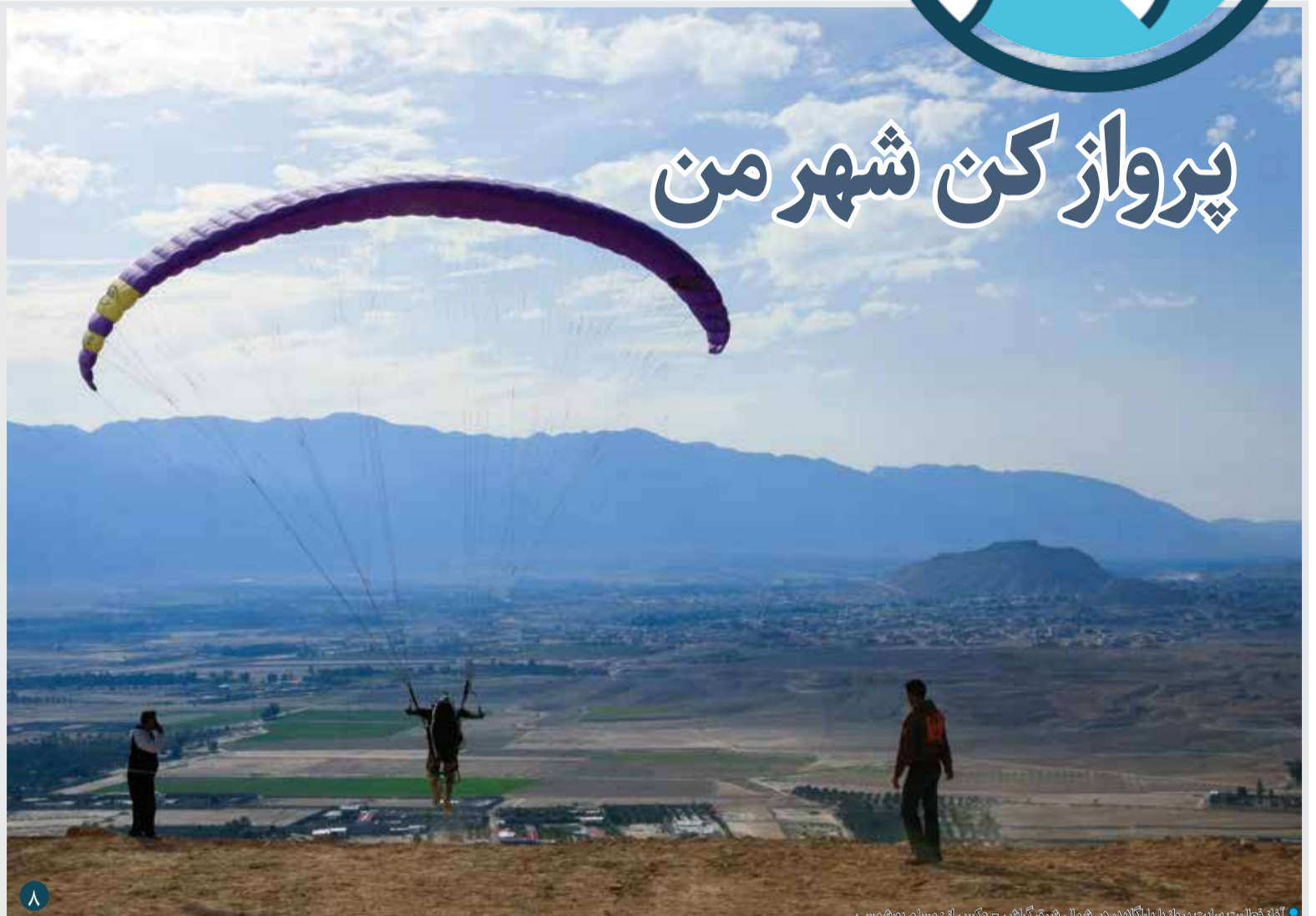
آغاز فعالیت سایت پرواز با پارگلایدر در شمال شرق گراش