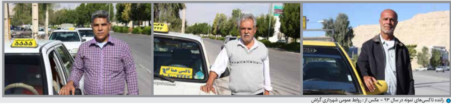
راننده تاکسی‌های نمونه در سال ۹۳