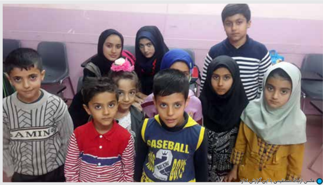
عکس ارتباط مستقیم با این گزارش ندارد