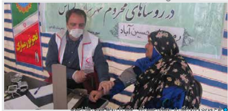
شرح ویزیت و فارواریگان در روستای حسین آباد