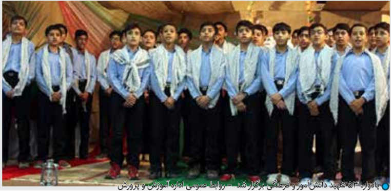
با آواز ۳۰۰ نفره همگانی برگزار شد - روایت عمومی اداره آموزش و پرورش