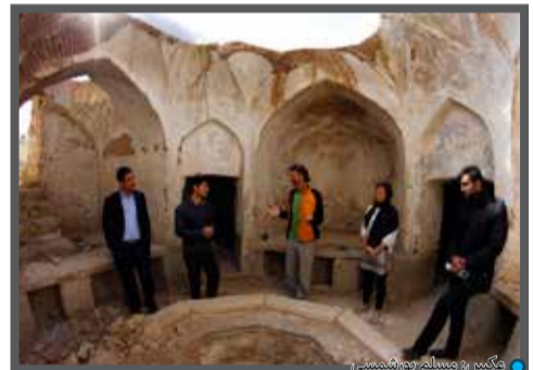
گراش و مسافران گردشگری در گراش

شهرداری گراش اعلام آمادگی کرده است از جهانگردانی که مسیر آن‌ها از گراش بگذرد در شهر گراش پذیرایی کند.