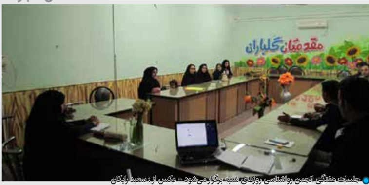
جلسات هفتگی انجمن روشنفکری روزهای شنبه برگزار می‌شود

مهمترین طرح‌های دهه فجر در ارد کنگ زده شد