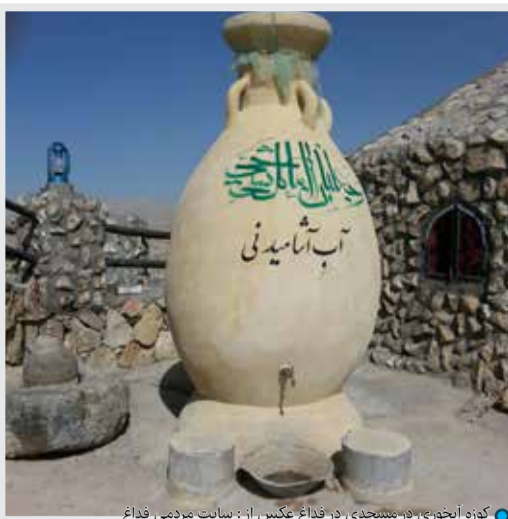
کوزه آبخوری در محله‌ی در فداغ