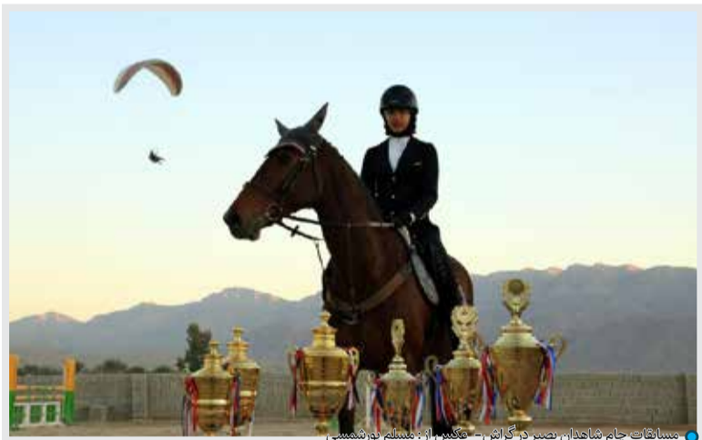
مسابقات جام شاهدان بصیر در گراش

افتتاحیه‌ی هیات وزنه‌برداری، خانه‌ی کشتی، هیات بدمینتون و هیات انجمن‌های پروازی نیز از جمله خبرهای خوبی است که در دهه‌ی فجر امسال خواهیم شنید.