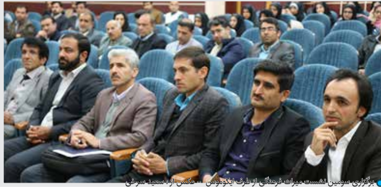
برگزاری هفتمین نشست هیات مدیره فرهنگیان از طرف انجمن معلمان