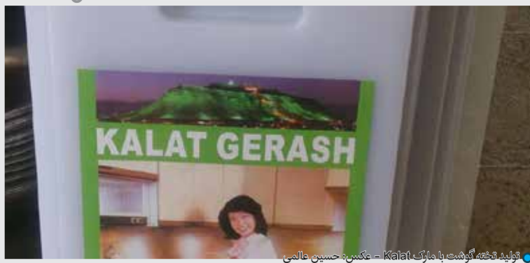
تولید گوجه‌گوش با جازک Kalat

تلفن: ۵۲۴۴۹۹۷۰ - ۰۷۱ ایمیل: gerash@gmail.com پيامک و واتساب: ۰۹۳۷۴۹۰۹۶۰۰ تلگرام: @gerash