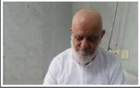
«حال عمومی امام جمعه پیشین گراش ساعد است