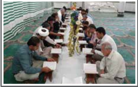
«آغاز برنامه‌های قرآنی مساجد کراش- ختم قرآن در مسجد حضرت خدیجه(س)