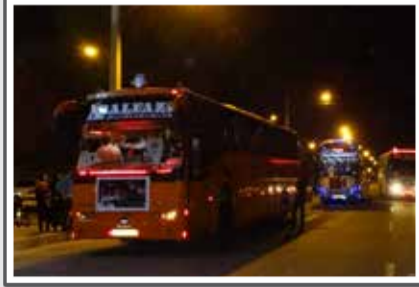
«۱۸۲۷ نفر زائر با ۲۳ اتوبوس از شهرستان‌های جنوب فارس به مرقد امام(ع) اعزام شدند