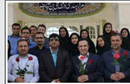
«مشارکت هیأت رییسه دانشکده علوم پزشکی در طرح «طیان»ها را تقدان کنیم»