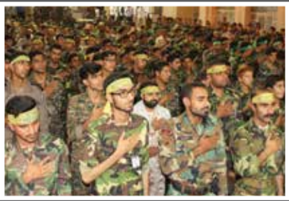
«رزمایش مدافعان حرم به میزبانی پایگاه علی بن ابیطالب(ع)»