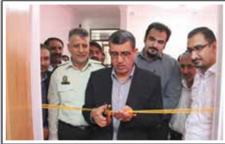
«افتتاح اداره و کلینک درمان سوسومر موادمخدر»